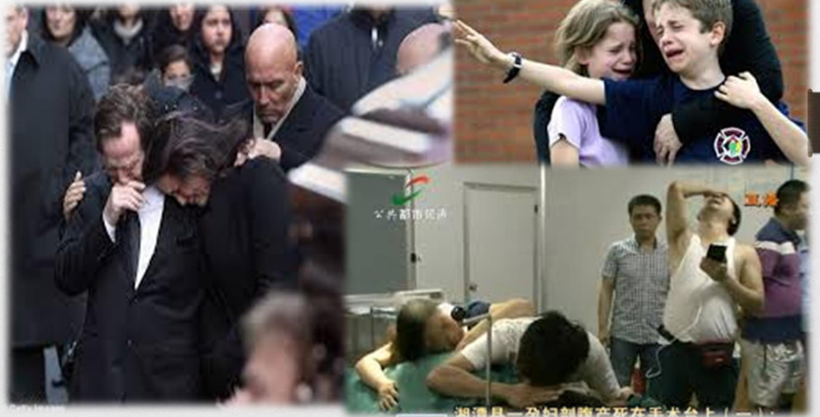
湘潭县一孕妇剖腹产死在手术台上(二)